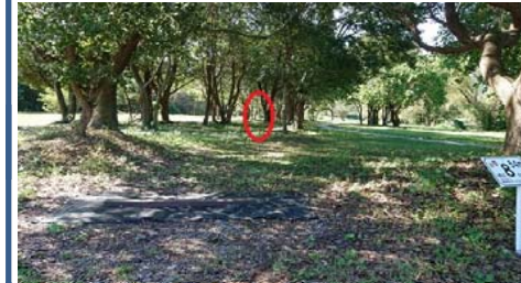
↑奥の茂みの中にゴール