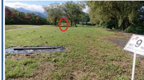
ゴール目視できます