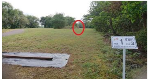
茂みの奥にチラッと#1ゴールが見える