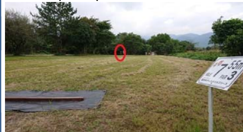
唯一、遊歩道をまたいでのホール 一般の方に気を付けてください