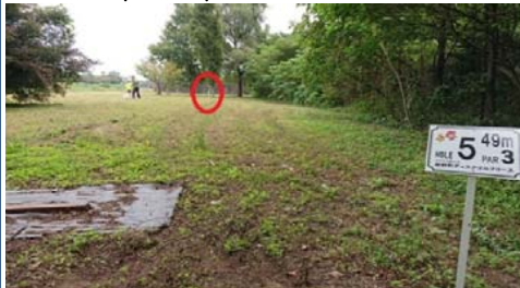
奥の堰堤の手前に、ゴール目視できます