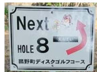
#7ゴール先に#8への案内があります 堰堤を迂回して次のホールへ進んでください