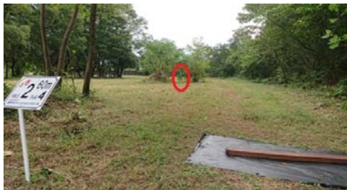
ゴール目視できます