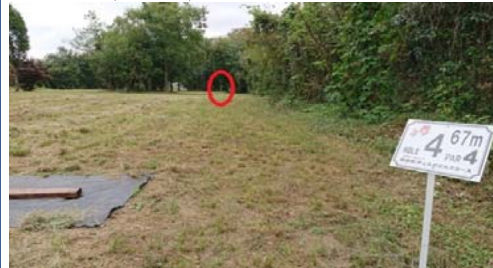
↑奥の茂みの中にゴール