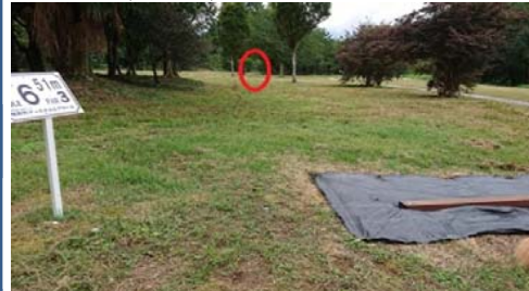
↑林の中、ゴールは少し見づらいかも