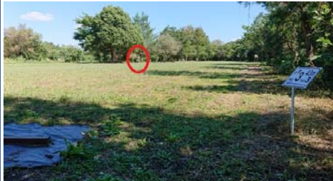
ゴール目視できます