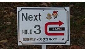
#2ゴール先に#3への案内があります 堰堤を迂回して次のホールへ進んでください